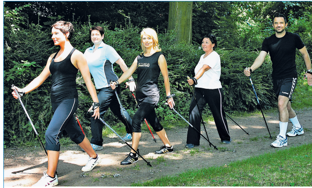
Nordic Walking: Völklingen bemüht sich auf vielfältige Art, Gesundheit und Fitness zu fördern.